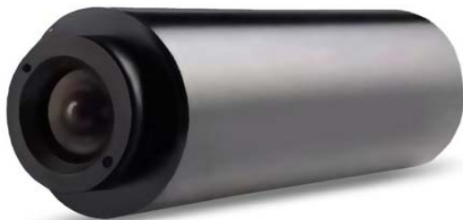
KPC-S190SB2 / KPC-S190SHB2 / KPC-S190SP4 / KPC-S190SWX

Профессиональная миниатюрная черно-белая цилиндрическая предназначена для контроля за состоянием на охраняемом объекте в жилых, коммерческих и производственных зонах. Низкая стоимость и небольшие габариты при отличном качестве делают эту камеру идеальным решением для внутренних систем видеонаблюдения.